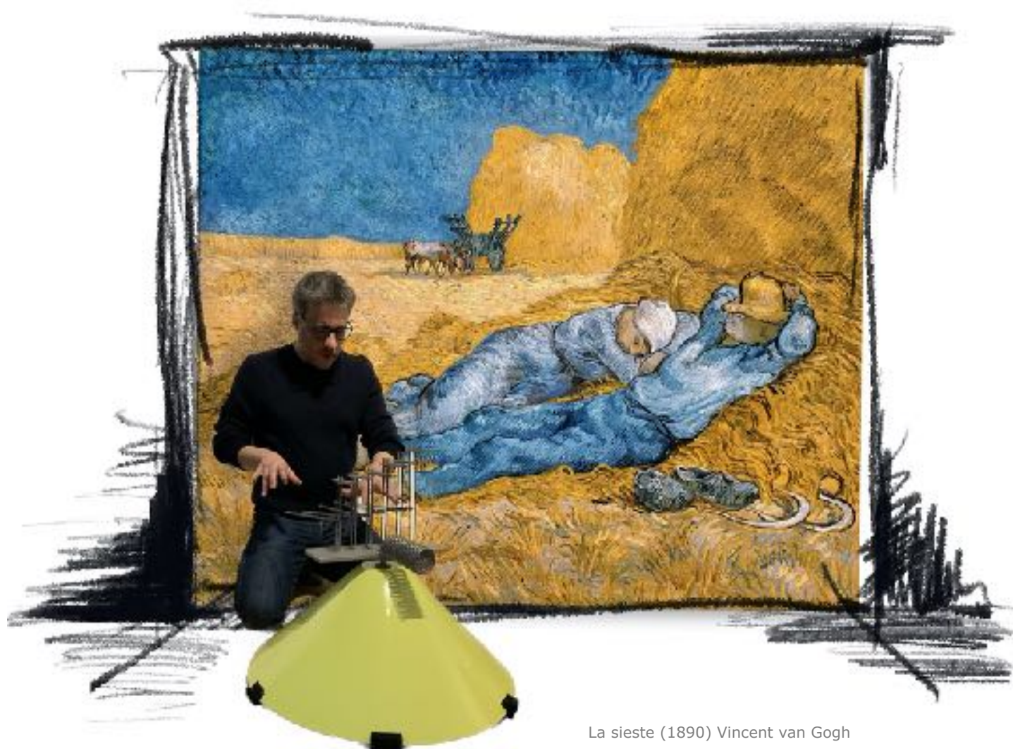
La sieste (1890) Vincent van Gogh