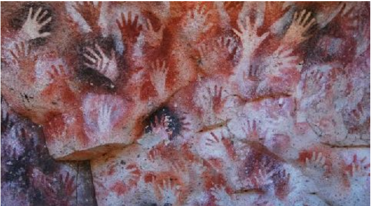
La Cueva de las manos, Argentine, Patagonie, 13000 ans av JC

« Morale » du conte : Un monde qui va bien est un monde multicolore et un monde de nuances.