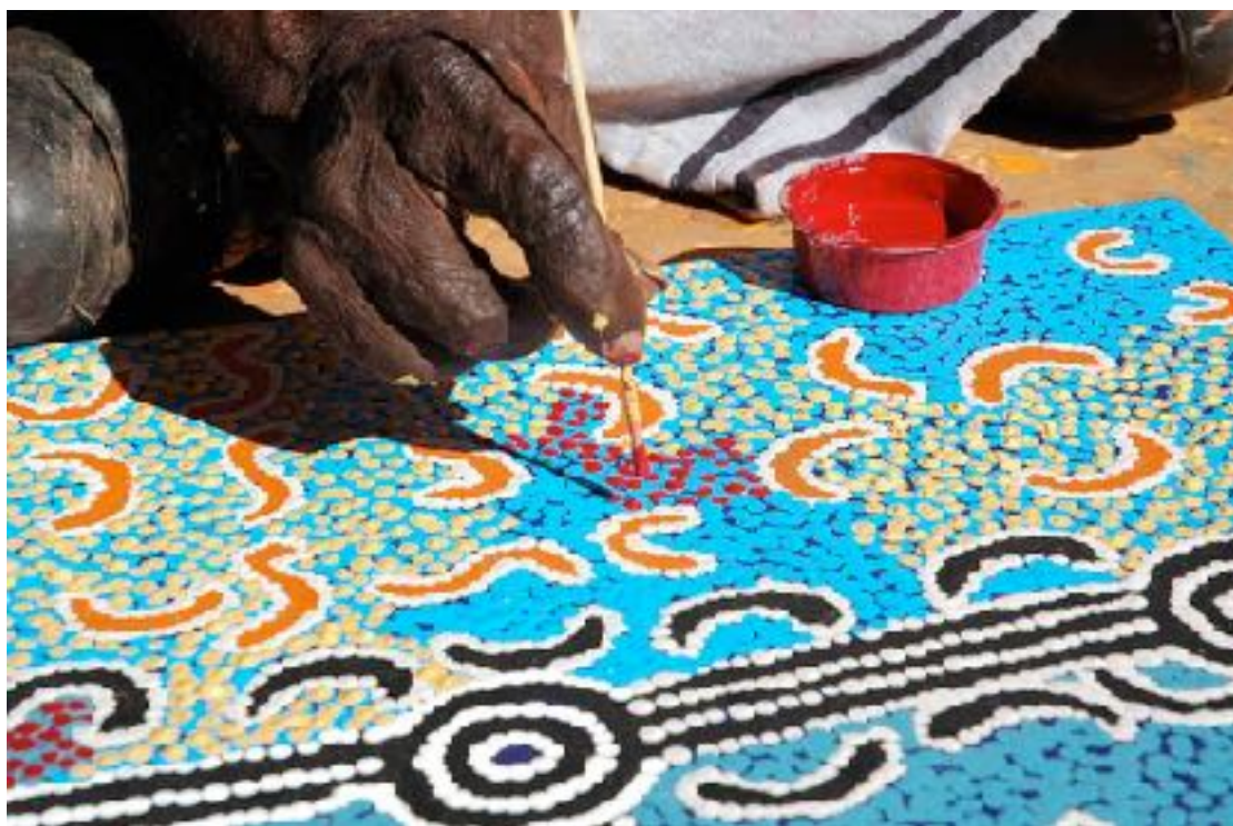
Peinture aborigène Australie (2002) Wenten Rubuntja