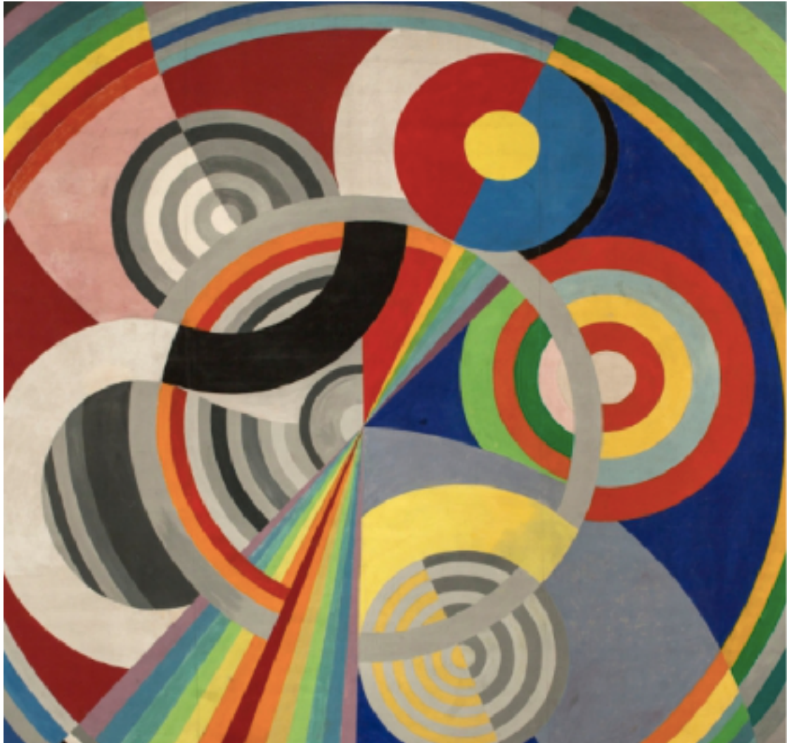
Rythme n°1 (1938) Robert Delaunay